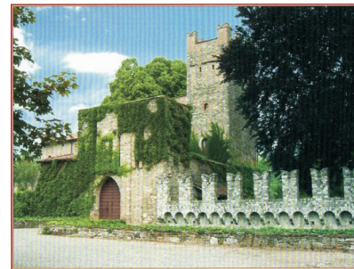
Il Castello di Riva