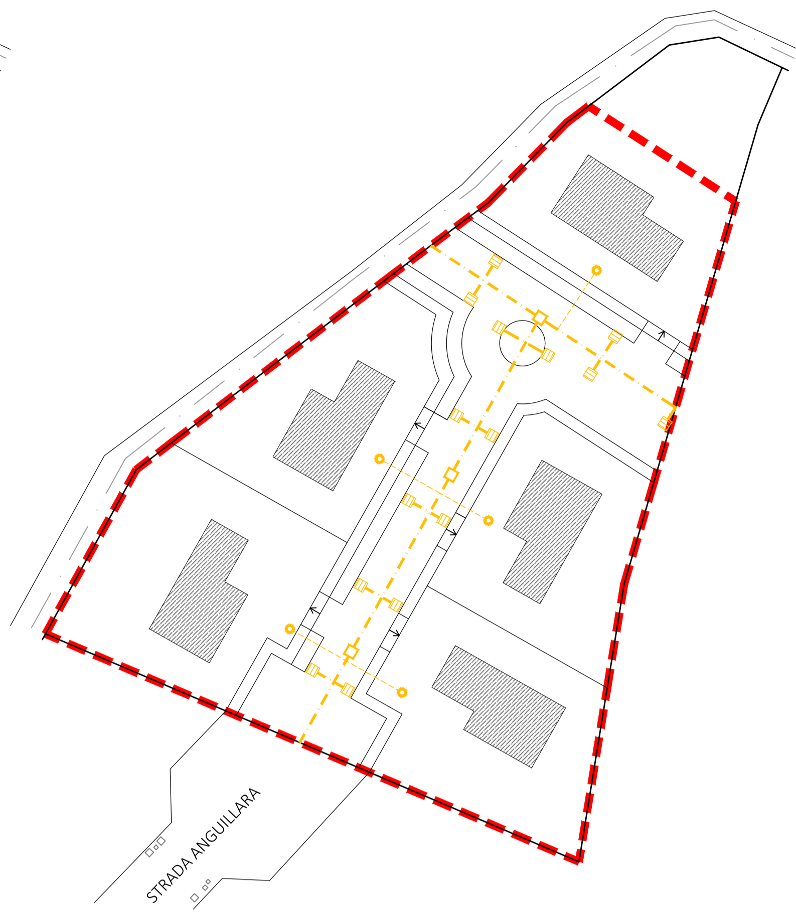
PLANIMETRIA GENERALE CON INDIVIDUAZIONE DELLE RETI ESISTENTI DI PROGETTO: RETE ACQUE DI PRIMA PIOGGIA