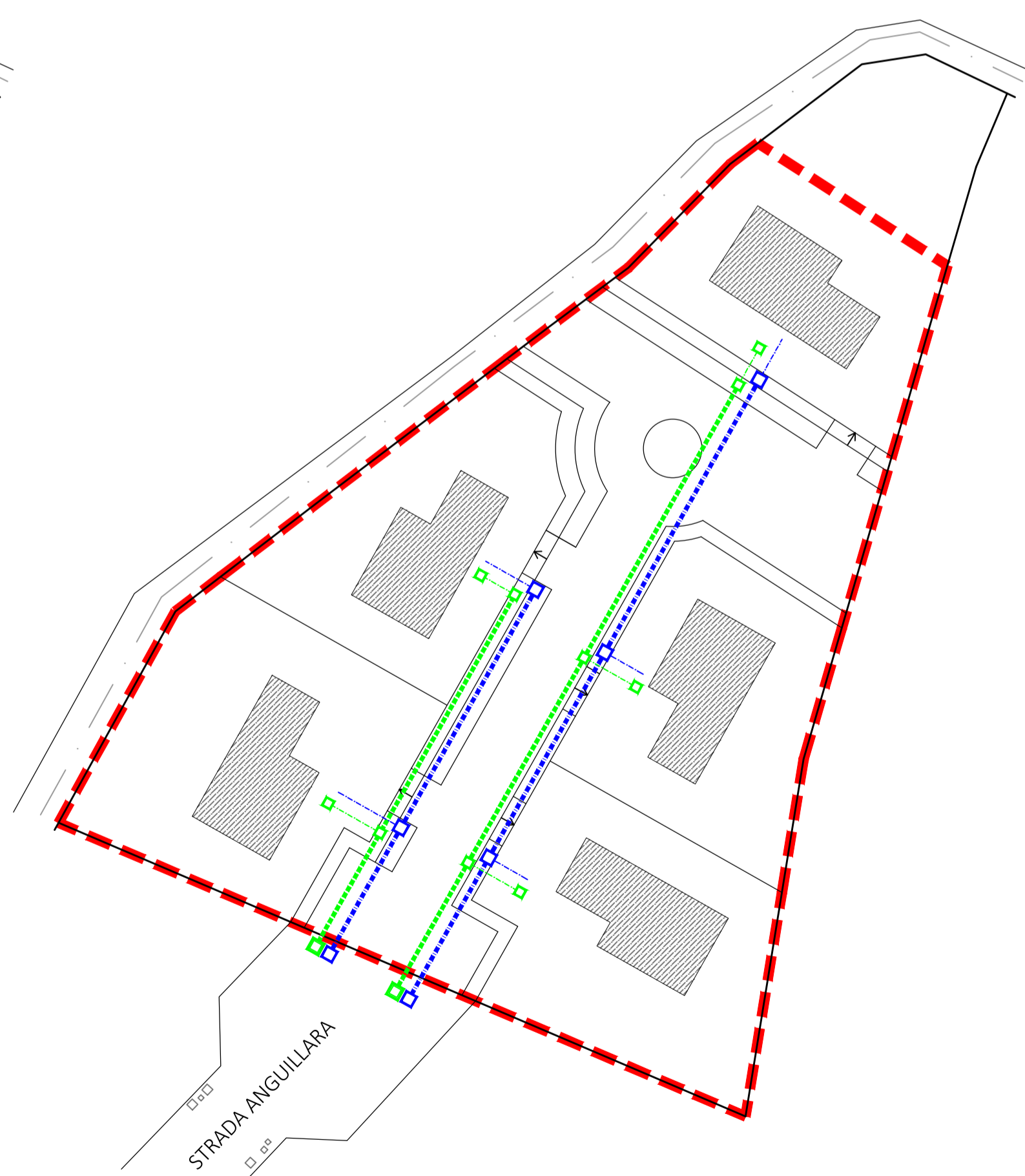
PLANIMETRIA GENERALE CON INDIVIDUAZIONE DELLE RETI ESISTENTI DI PROGETTO: RETE ELETTRICA E TELEFONICA