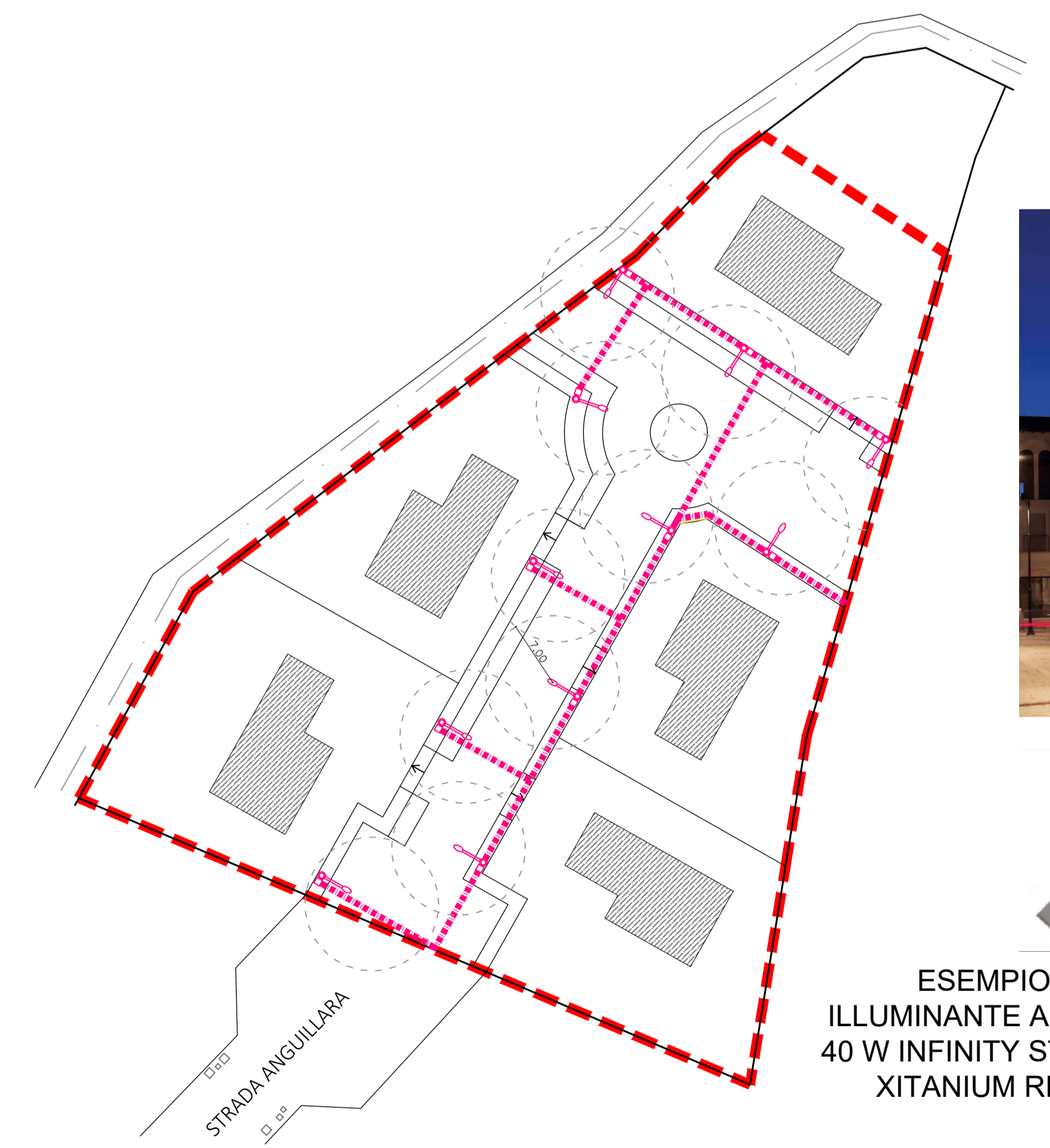
PLANIMETRIA GENERALE CON INDIVIDUAZIONE DELLE RETI ESISTENTI DI PROGETTO: RETE ILLUMINAZIONE PUBBLICA