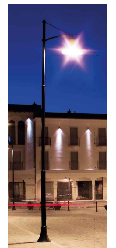
ESEMPIO CORPO ILLUMINANTE A LED TIPO LED 40 W INFINITY STREET PHILIPS XITANIUM REGOLABILE