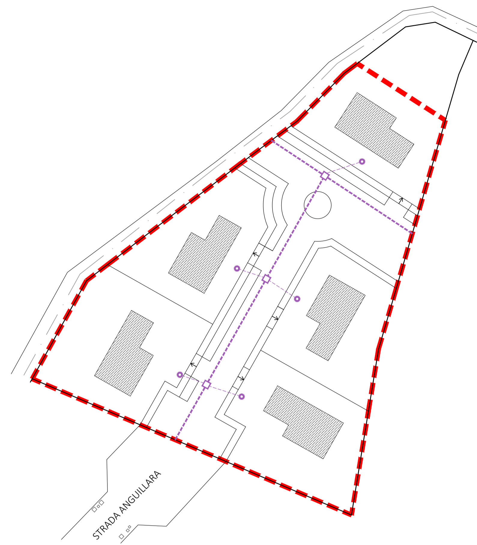
PLANIMETRIA GENERALE CON INDIVIDUAZIONE DELLE RETI ESISTENTI DI PROGETTO: RETE ACQUE DOMESTICHE