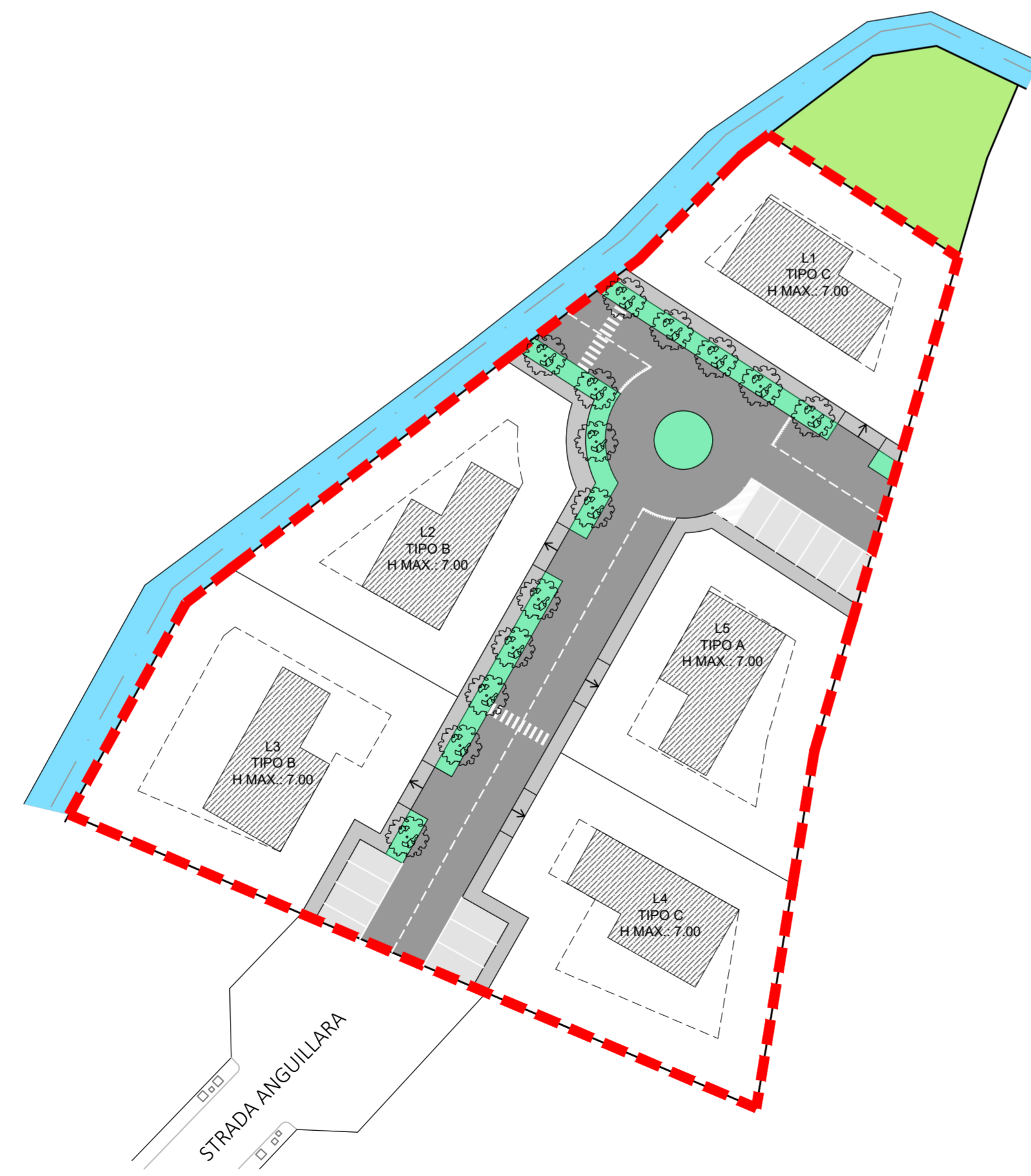
PLANIMETRIA GENERALE CON PLANIVOLUMETRICO DI PROGETTO - scala 1:500