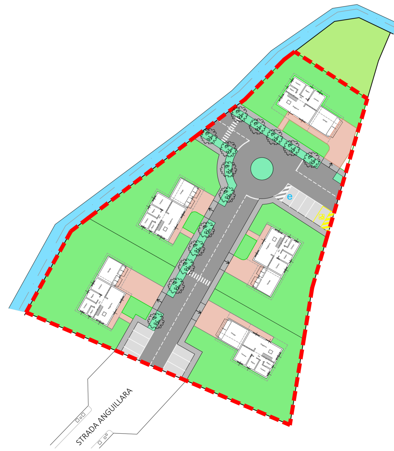
PLANIMETRIA GENERALE CON SCHEMA DISTRIBUTIVO DELLE TIPOLOGIE EDILIZIE - scala 1:500