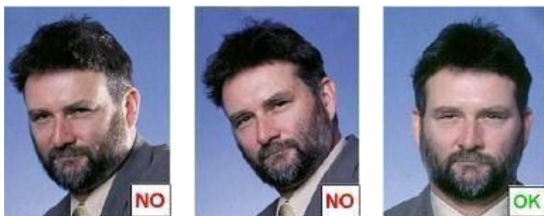
angolata da Posizione inclinata del capo Posizione ritratto in studio

Il viso non deve essere inclinato ne' lateralmente ne' verticalmente e non sono ammesse posizioni artistiche (niente viso girato, profili, spalle alzate, ecc.); l'inquadratura deve essere frontale, lo sguardo rivolto verso l'obiettivo (Fig.5) figura 5