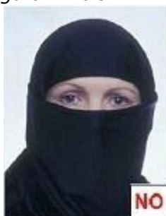
figura 12 bis