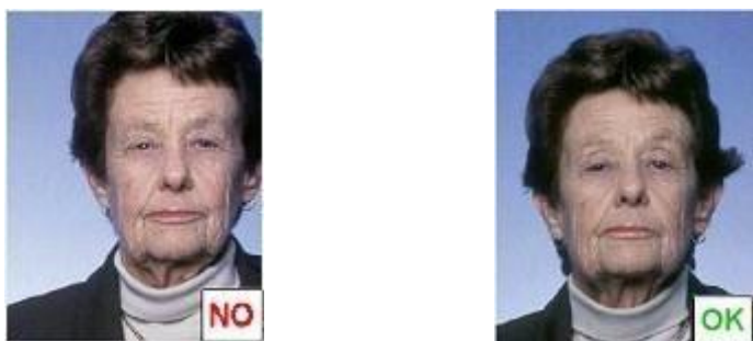
Testa non centrata

La testa deve essere centrata verticalmente (Fig.6) figura 6