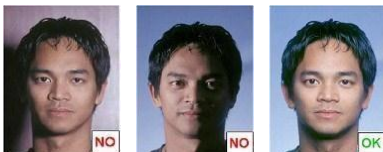
Ombra sullo sfondo Ombra sul viso

Non ci devono essere ombre ne' sul viso ne' sullo sfondo (Fig.7) che deve essere uniformemente illuminato figura 7