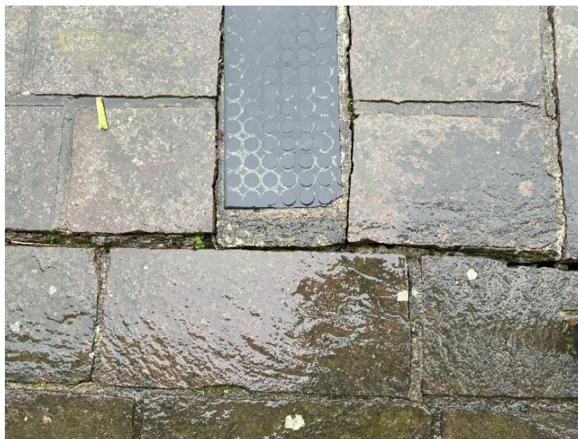
Particolare del Distacco della Pavimentazione