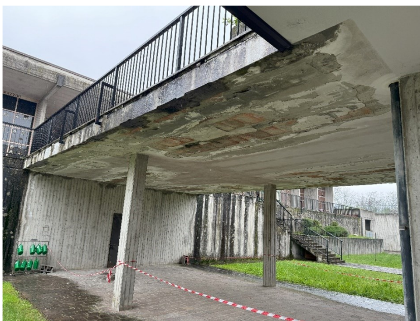
Particolare del Solaio