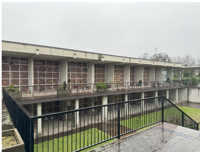
Vista di porzione già sistemata