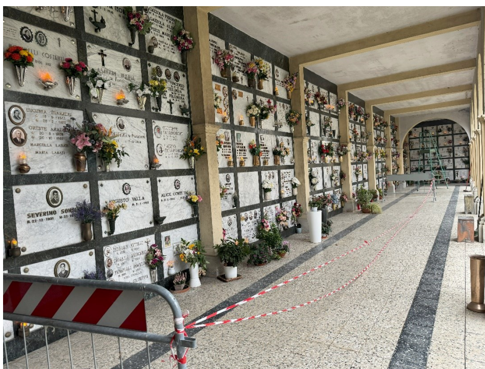
Particolare della zona soggetta all'intervento

Sono state individuate circa cento (100) lastre facenti parte dei tamponamenti di lapidi in marmo che interessano un'area dell'ala Ovest del nuovo cimitero. Queste sono distaccate dal supporto murario sottostante e l'intervento in progetto prevede il fissaggio delle stesse con ancoraggi realizzati mediante l'utilizzo di borchie metalliche (acciaio inox) al supporto sottostante, così da evitare futuri distacchi dovuti al cedimento delle colle utilizzate negli anni passati.